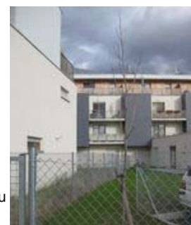
Cité Wagner - Mulhouse

Une cinquantaine de participants (élus, architectes, professionnels du bâtiment, techniciens...) ont pu découvrir à Fribourg, les quartiers Riedelfeld, Vauban et le lotissement solaire et à Mulhouse, la boutique du zoo et la cité Wagner.